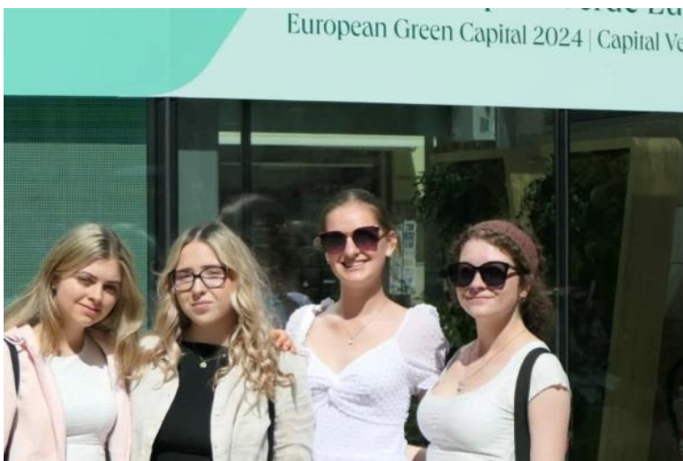
Studentky na Erasmus ve Španělsku.