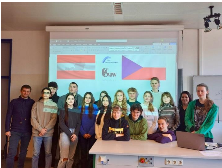
První návštěvu na partnerské škole ve Vidni absolvovali studenti GJW v únoru 2025.