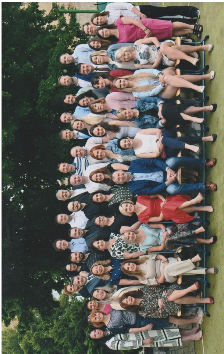
Fotografie pedagogického sboru ze dne 2. června 2025