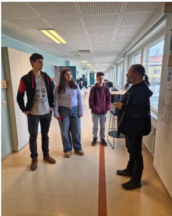
Tradičním partnerem GJW je finská škola v městečku Leppävirta.

Na nejstarším prostějovském gymnáziu se už nyní plánuje pokračování v dalších mezinárodních projektech. V příštím školním roce by škola chtěla prohlubovat spolupráci s novými partnery ve Vídni a v Maďarsku , aby se do aktivit mohlo zapojit ještě více studentů i učitelů.